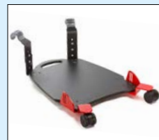
Ståplatta kort/lång, länkhjul (SW)