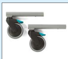
Tippskydd - bakåt