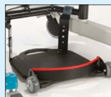
Hälband till ståplatta