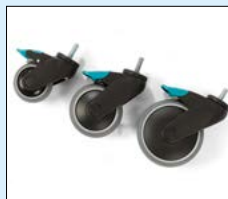
Hjul med broms 75, 100, 125mm