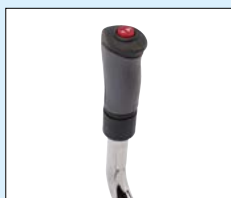
Styrning/handtag - vippströmbrytare