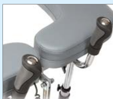
Styrning/handtag - tryckströmbutare