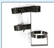
Tubhållare inkl. fäste