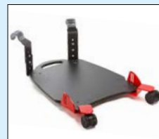
Ståplatta kort/lång, länkhjul (SW)