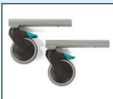
Tippskydd - bakåt