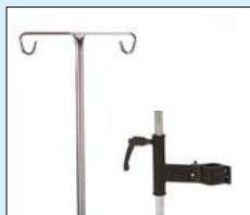
Droppstång inkl. fäste