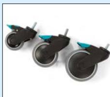
Hjul med broms 75, 100, 125mm