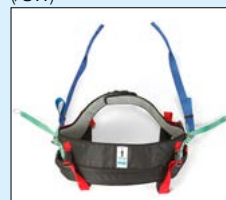
Gåtränings Kit Multi Med Gåträningskit MULTI så gör du din uppresningssele till en gåträningssele