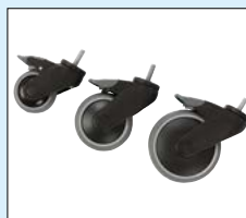
Hjul med riktningsspärr 75, 100, 125mm