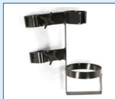
Tubhållare inkl. fäste