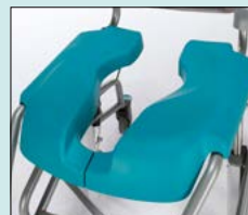
Sits, komfort med öppning bakåt