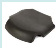
Sits, mjuk svart hel