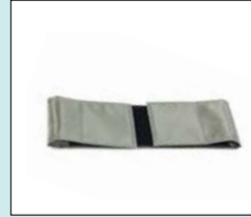
Vadband extra stöd åt underben