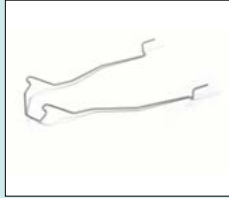
Gejder - för plast eller metallbäcken