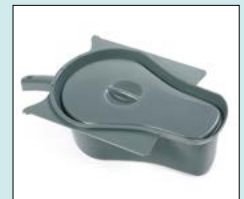
Uppsamlingskärl med lock/nyckelhål