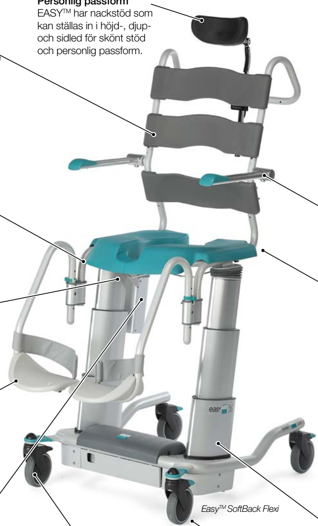
Easy™ SoftBack Flexi

De teleskoperande pelarna i aluminium har en öppen design som gör att vatten/smuts enkelt rinner igenom.