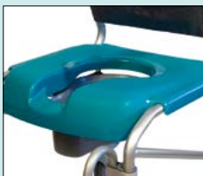
Sits, plast/grön med hygienurtag, 56-233