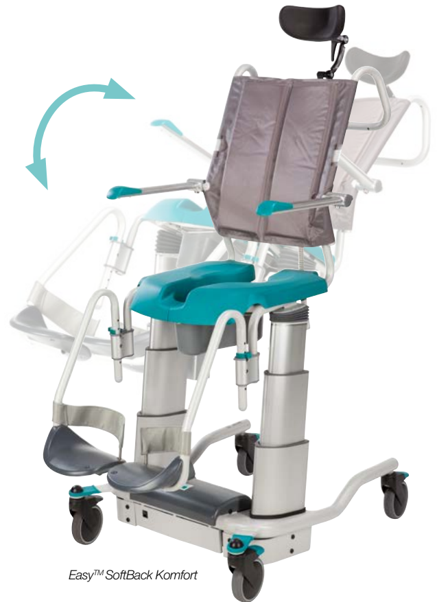
Easy™ SoftBack Komfort

I samband med dusch och tvätt blir användaren ofta sittande i stolen länge, vilket kan vara mycket påfrestande. EASY™ har därför tagits fram för att erbjuda en mycket hög komfort. Sittandes i EASY™ kan användaren inta en så normal kroppsställning som möjligt. Hygienstolen får snabbt en