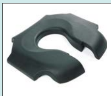
Sits, mjuk PU, Svart, hygienurtag