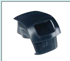
Plugg för mjuksits - ger tillsammans med 56-206 en duschsits