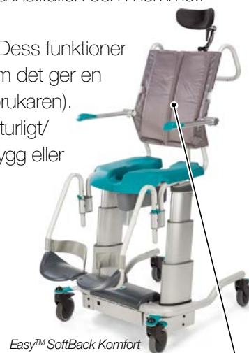
Easy™ SoftBack Komfort

EASY™ har nackstöd som kan ställas in i höjd-, djup- och sidled för skönt stöd och personlig passform.