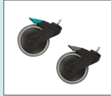
Hjul med broms 125 mm Hjul med riktningsspår 125 mm