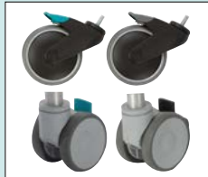
Hjul med broms/riktningsspär 100mm eller 125mm