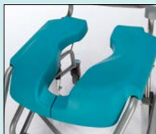
Sits, komfort med öppning bakåt