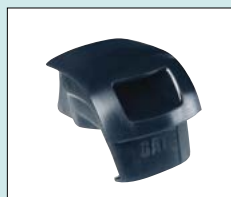
Plugg för mjuksits - ger tillsammans med 56-206 en duschsits