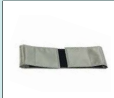
Vadband extra stöd åt underben