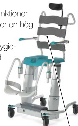
Easy™ SoftBack Flexi

EASY™ kan fås med vår nya, mjuka Komfortsits - med öppning bakåt för ett mer naturligt/hygieniskt arbetssätt. EASY™ Softback finns i två varianter - med traditionell komfortrygg eller med ryg av PUR band.