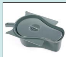
Uppsamlingskärl med lock/nyckelhål