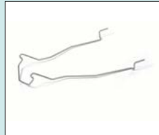
Gejder - för plast eller metallbåcken