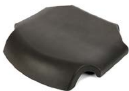
Hel mjüksits 56-236

56-359 125 mm 56-355 100 mm 57-043 75 mm