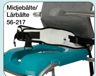
Midjebälte/ Lärbälte 56-217

Fotstöd till vinkel- ställbara benstöd (DOUBLE/XL) Används i kombination med amputations- eller vadstöd