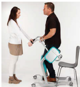
4. Placera Mover så att vårdtagaren enkelt kan placera sina fötter på fotplattan och knä/underben mot underbenstödet. Låt vårdtagaren greppa i den tvärgående stängeln och sedan resa sig upp.