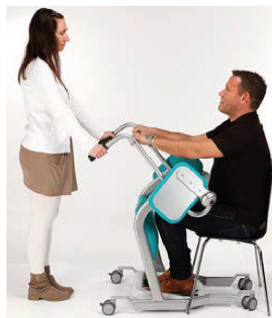
2. Kör intill vårdtagaren.