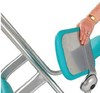
1. Fäll upp de två säteshalvorna.