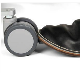
3. Lås bromsen