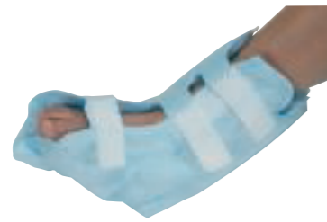
Hälskon avlastar vid sår, motverkar "droppfot" och skyddar känsliga fötter.