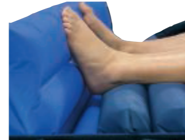
ZIP avlastningscell, för avlastning av hälar (eller andra kroppsdelar), samt för positioneringshjälp och skydd mot sängens gavlar.

Alla Gaymars tryckavlastningsmadrasser kan fås med överdrag belagda med äkta silver, Silver3™ (Smith & Nephew). Silver3™ har dokumenterat bakteriedödande egenskaper – det verkar inte bara nedbrytande på bakteriens cellväggar (som antibiotika gör) utan förstör också bakteriernas DNA, och stör delningsprocessen. Silver3™ motverkar därmed smittspridning på ett mycket effektivt sätt vid behandling av patienter med bakteriella sjukdomar, till exempel MRSA och MSSA.